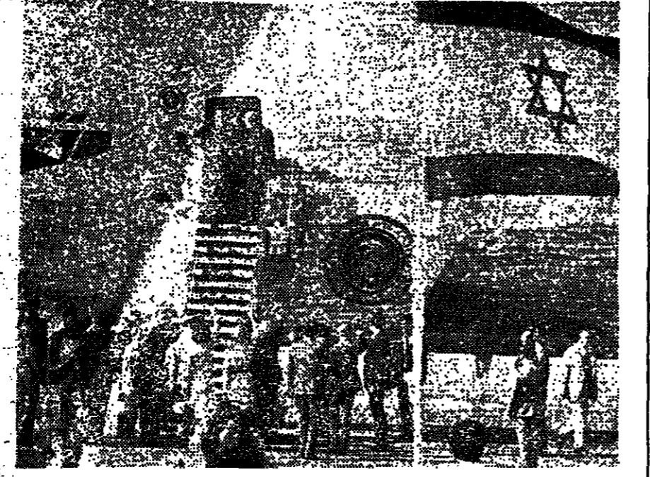
הנסיא רייזארד ניכסון העייתו עם נפרדים ממלחמות במלך בן-גוריון, לפני המראה לירבית צמח.